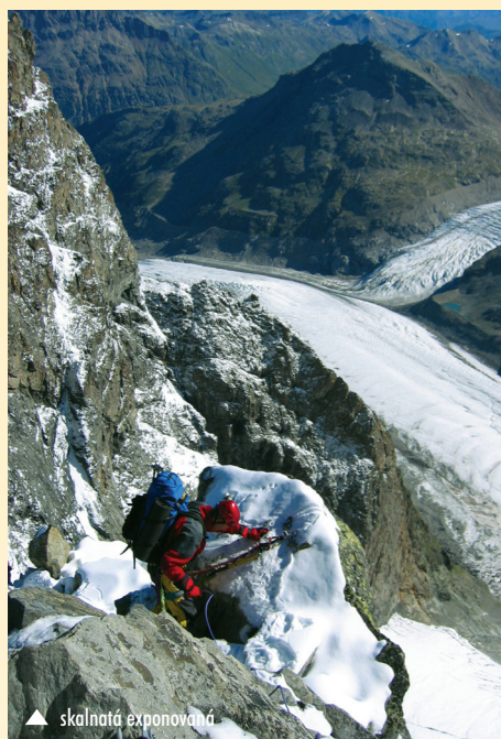
▲ skalnatá exponovaná

Zpátky na dva krát jedna metrové plošině na vrcholu Piz Bianco navíc zjišťuji, že se mačka s chybějícím jedním středovým šroubem uprostřed tak trochu „zlomila“. Ne dolů to s ní opravdu nepůjde. Nebo bude muset? Co teď?