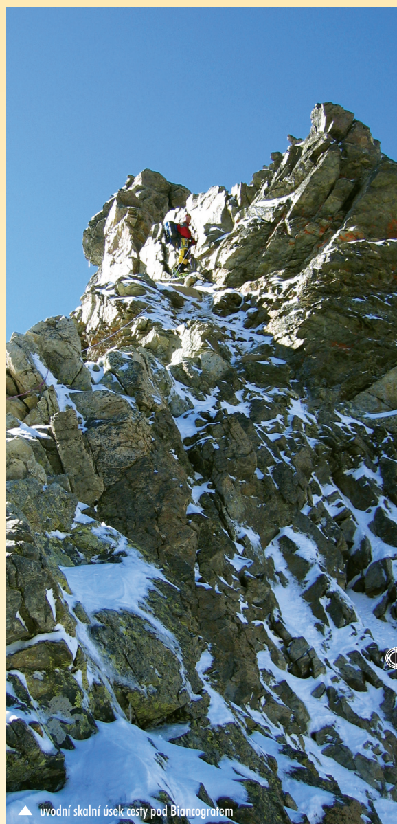
▲ úvodní skalní úsek cesty pod Biancostratem